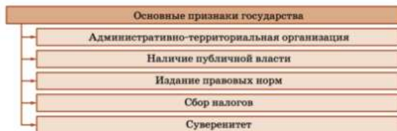
сх 14. знаки рства

Все определения государства позволяют четко выделить основные признаки (схема 14).