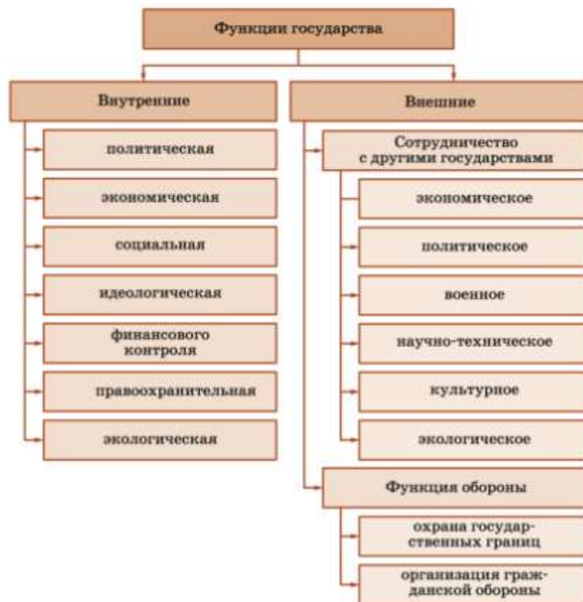
Схема 16. Функции государства

Внутренние функции государства — это основные направления деятельности государства внутри страны.