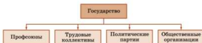
Схема 15. Политическая система общества

Политические институты — это не только отношения в рамках политической системы общества, но и ее элементы. Элементы (субъекты) политической системы общества представляют государство и его отдельные органы, политические партии, общественные организации, профсоюзы, трудовые коллективы, фонды, организации по возрастному, профессиональному, половому, религиозному признакам. Все они в той или иной мере принимают участие в политической жизни страны (схема 15). Содержание политической системы составляют политическое сознание, нормы, регулирующие политическую жизнь общества, отношения между элементами политической системы, политическая практика.